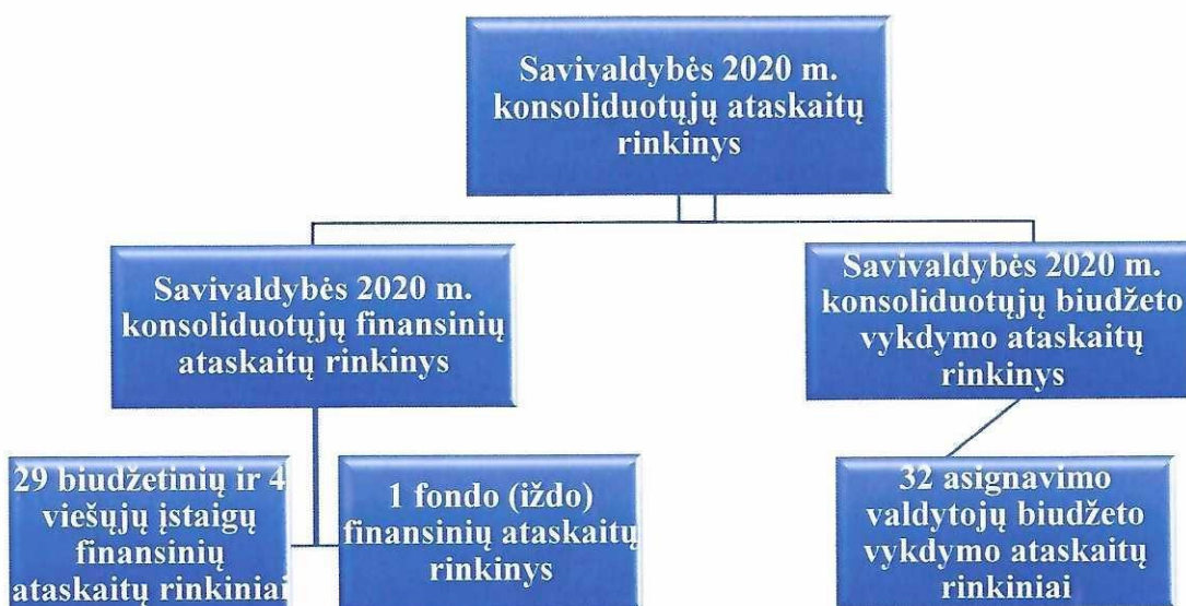
1 pav. Savivaldybės konsoliduotųjų ataskaitų rinkiniai