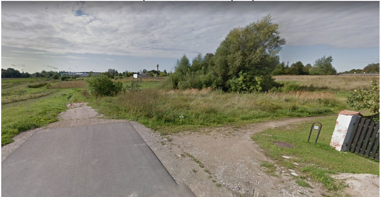
3.2.1.1. pav. V.Kudirkos g., fotofiksacija

V.Kudirkos g. važiuojamoji dalis iki rengiamos atkarpos yra 4,5 m pločio su asfalto danga ir kelkraščiais. Lietaus vanduo nuvedamas į šalikėlis, lietaus nuotekų tinklų nėra.