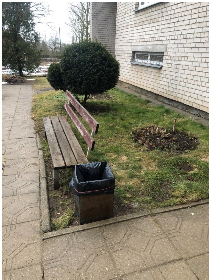
PRIE LAIPTINIŲ NUMATOMI PAKEISTI SUOLIUKAI IR ŠIUKŠLIADĖŽĖS