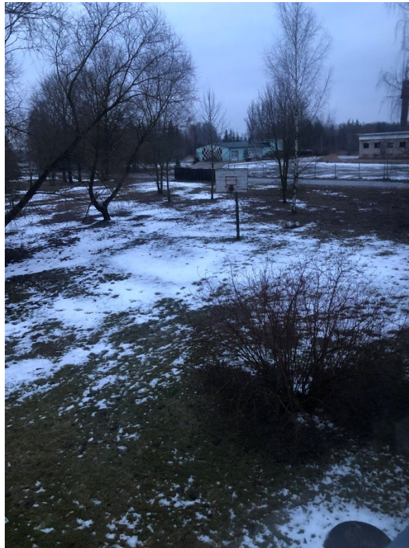
SUTRŪNIJUSI KREPŠINIO LENTA