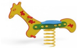
SPYRUOKLINĖ SŪPYNĖ „ŽIRAFĀ“ N3003 421,08€ Kaina 378,97 € su PVM

1184 € + PVM -1432,64 € Šis gaminytis turi sertifikatą EN1176. Spalvas galime derinti pagal užsakovo pageidavimus. Matmenys: Diametras – 1600mm, aukštis – 650mm. Uždari guoliai - 2 vnt. Guoliai keičiami.