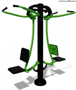
Treniruoklis SM102 Kaina 877,25 €.