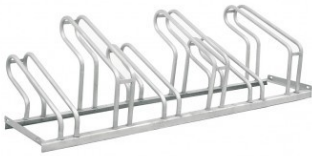
6 vietų dviračių stovas Bazinė kaina Kaina 205,70 € Kaina 185,13 €