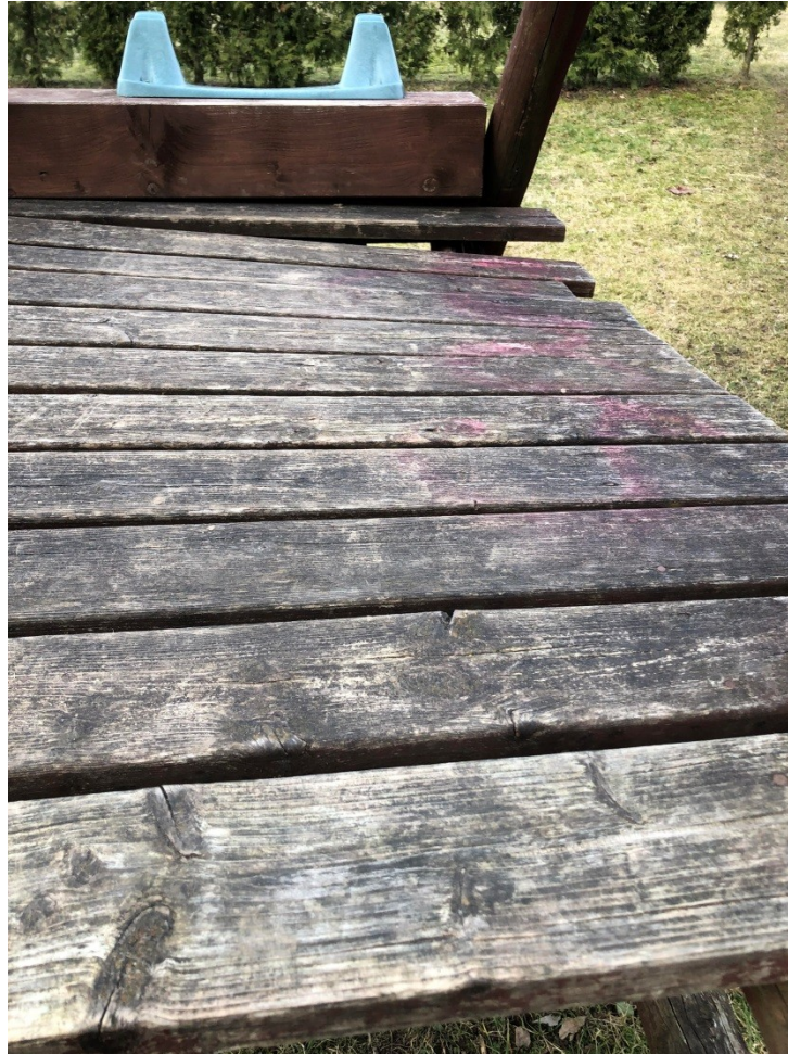
SULŪŽĘ VAIKŲ ŽAIDIMŲ ĮRENGIMAI, ESANTYS ŠALIA VĖJO 9C IR 9B