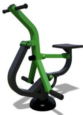
Treniruoklis SM110 Kaina 471,90 €.