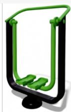
Treniruoklis SM115 Kaina 637,67 €.