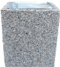
A1 Betoninė šiukšliadėžė U60

Bazinė kaina Kaina 133,10 € Kaina 119,79 €