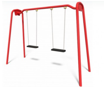
A11 Sūpynės TE407

Bazinė kaina Kaina 726,00€ Kaina 653,40 €