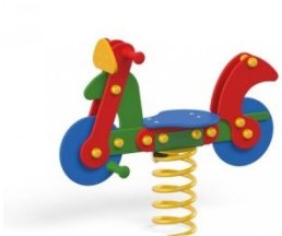
SPYRUOKLINĖ SŪPYNĖ „MOTOCIKLAS“ N3004 KAINA 435,60 EURŲ.