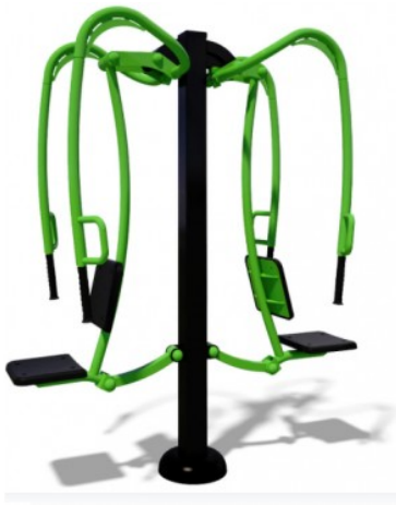
Treniruoklis SM101 Kaina 1 003,09 €.